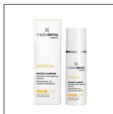
PROTECT & REPAIR

SKŁAD: filtry przeciwsłoneczne fizyczne i chemiczne. 50 ml