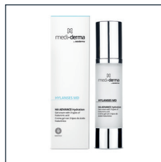
HA ADVANCE Hydration

SKŁAD: kwas hialuronowy zamknięty w liposomach, retinol, retinaldehyd, ceramidy. 30 ml