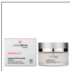
GLOBAL RESTRUCTURING Intensive

SKŁAD: wolne i liposomowane DMAE, krzem organiczny, ekstrakt z Caesalpinia Spinosa i Kappaphycus Alvarezii. 30 ml