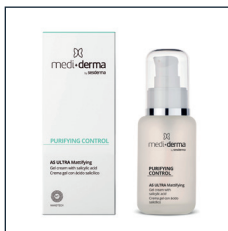
AS ULTRA Mattifying

SKŁAD: kwas salicylowy, triklosan, Aloe Barbadensis, łagodzące wyciągi z roślin. 200 ml