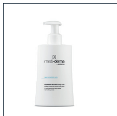
CLEANSER MOUSSE Daily care

Codziennie oczyszczanie i intensywne nawilżanie wszystkich rodzajów skóry, w tym wrażliwej i skłonnej do podrażnień.