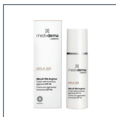
BELLIS TRX Brighter

Opiera się na składnikach depigmentujących, redukuje i zapobiega powstawaniu przebarwień, wyrównuje koloryt skóry.