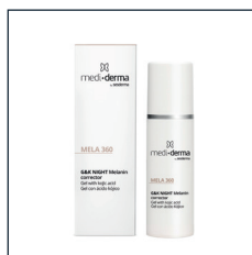
G&K NIGHT Melanin corrector

SKŁAD: kwas traneksamowy, składniki depigmentujące, kwas azelainowy, ekstrakt z melisy, niacyna. 30 ml