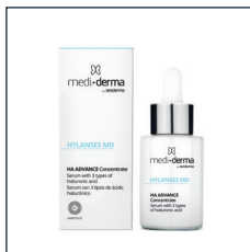
HA ADVANCE Hydration

SKŁAD: Aloe Barbadensis, owies, rumianek, mimoza. 200 ml