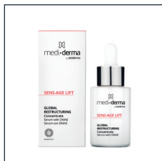
GLOBAL RESTRUCTURING Concentrate

Skóra wymagająca intensywnego i natychmiastowego efektu liftingu. Zapobieganie i usuwanie objawów starzenia się skóry, która potrzebuje restrukturyzacji, uelastycznienia i ujędrnienia.