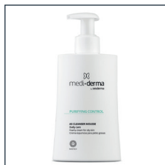
AS CLEANSER MOUSSE

Skóra z tendencją do trądziku lub z jego widocznymi objawami.